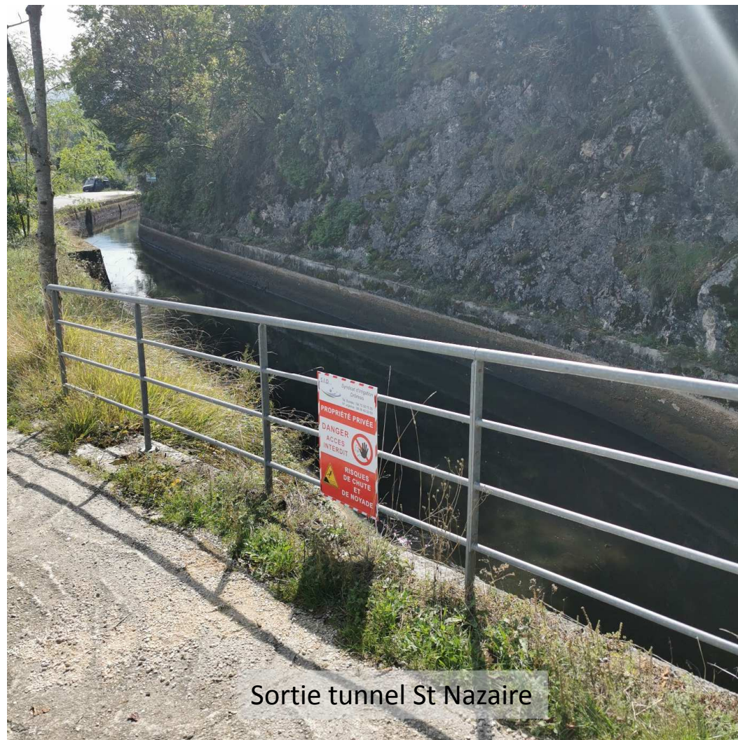
Sortie tunnel St Nazaire