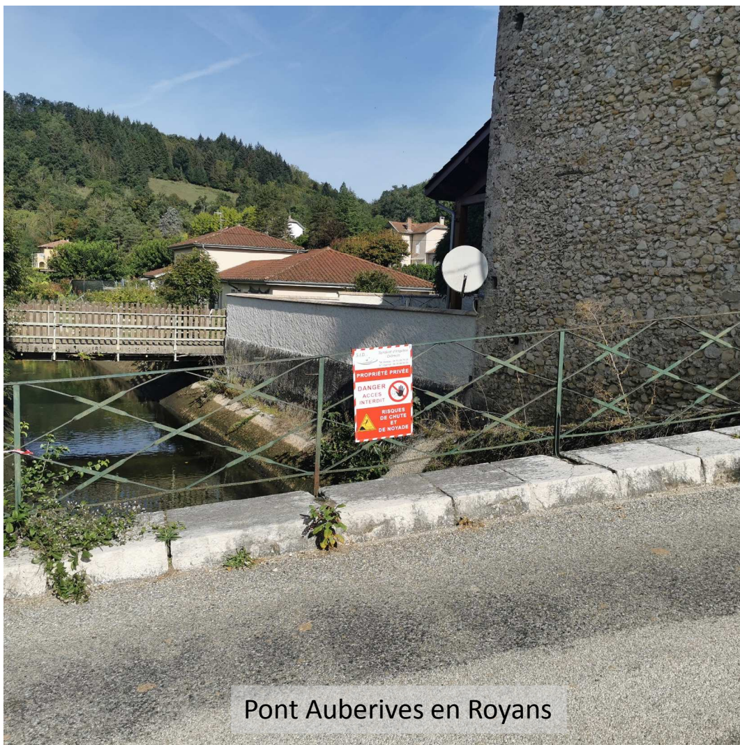
Pont Auberives en Royans

ID : 026-200040517-20231004-20231004_01-AR