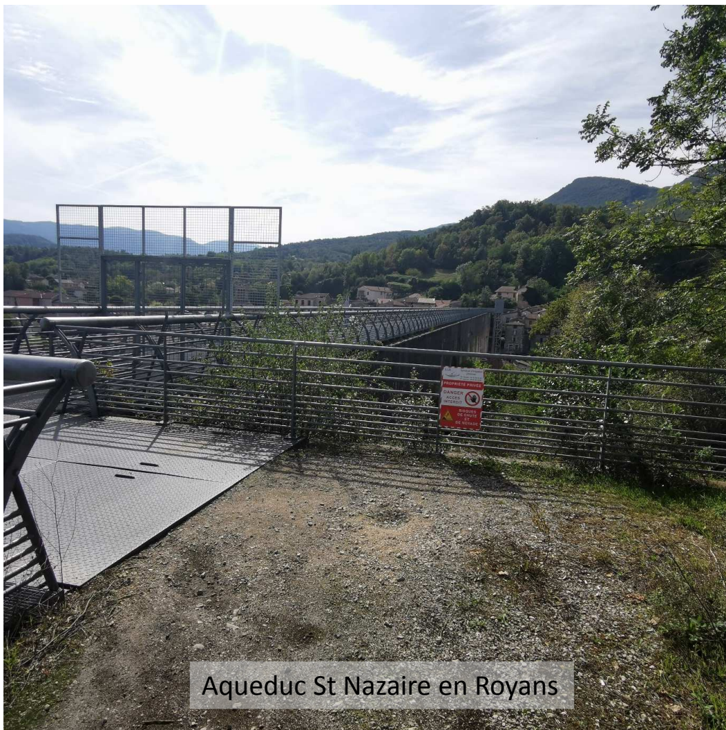
Aqueduc St Nazaire en Royans

ID : 026-200040517-20231004-20231004_01-AR