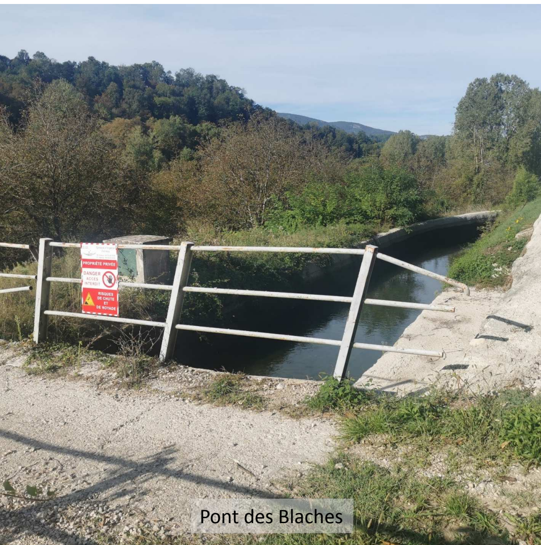
Pont des Blaches

ID : 026-200040517-20231004-20231004_01-AR