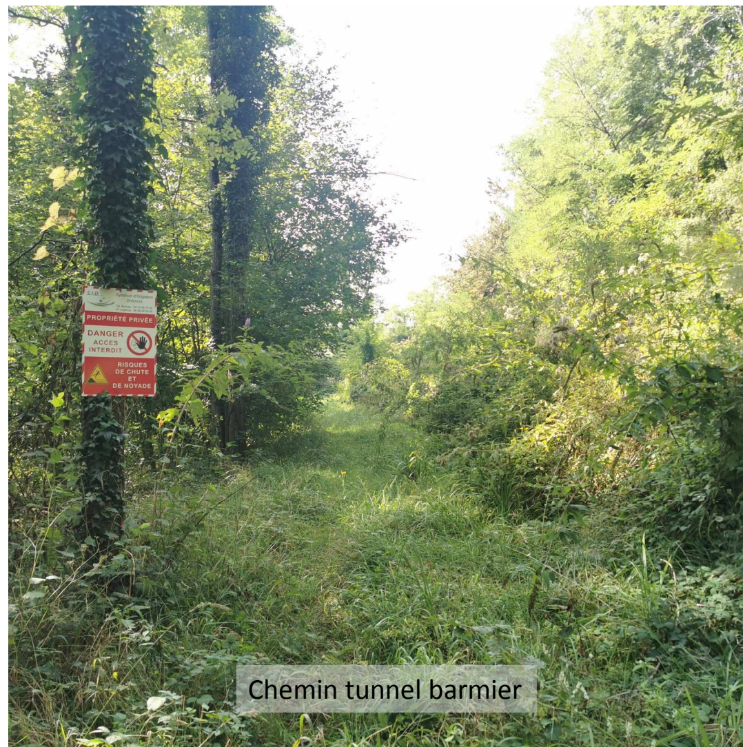
Chemin tunnel barmier