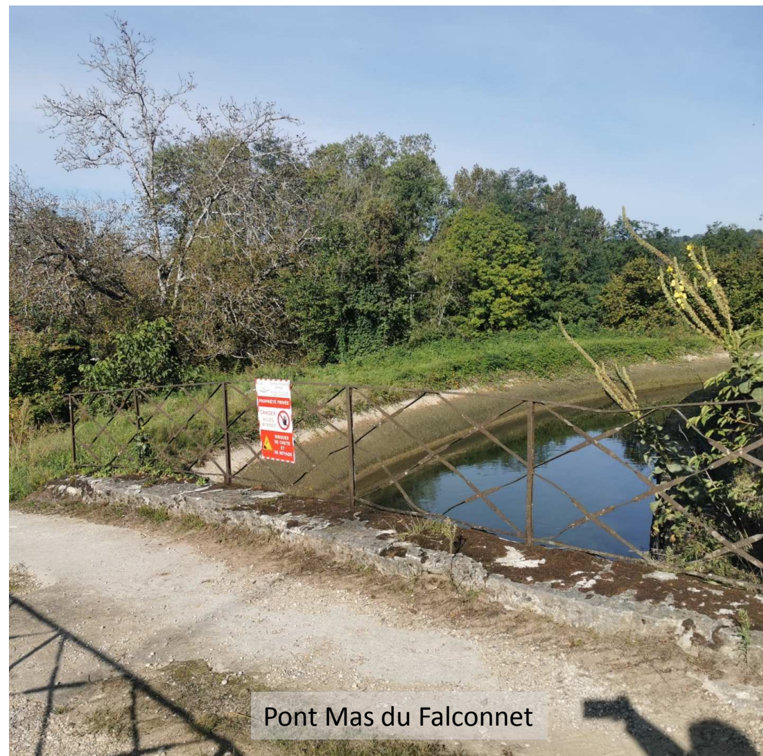
Pont Mas du Falconnet