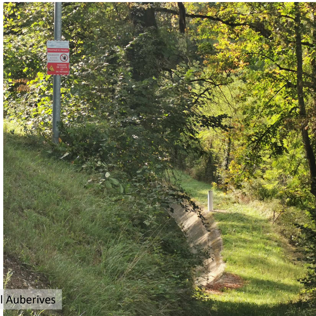
Entrée tunnel Auberives