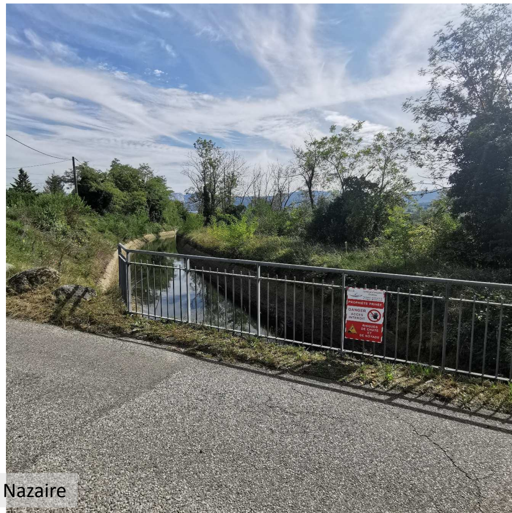
Ponts montée St Nazaire