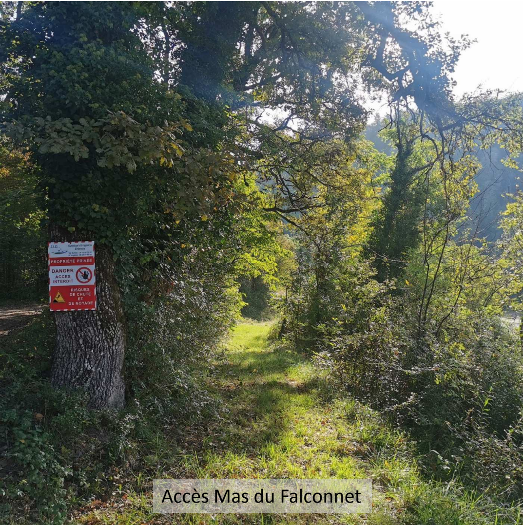
Accès Mas du Falconnet