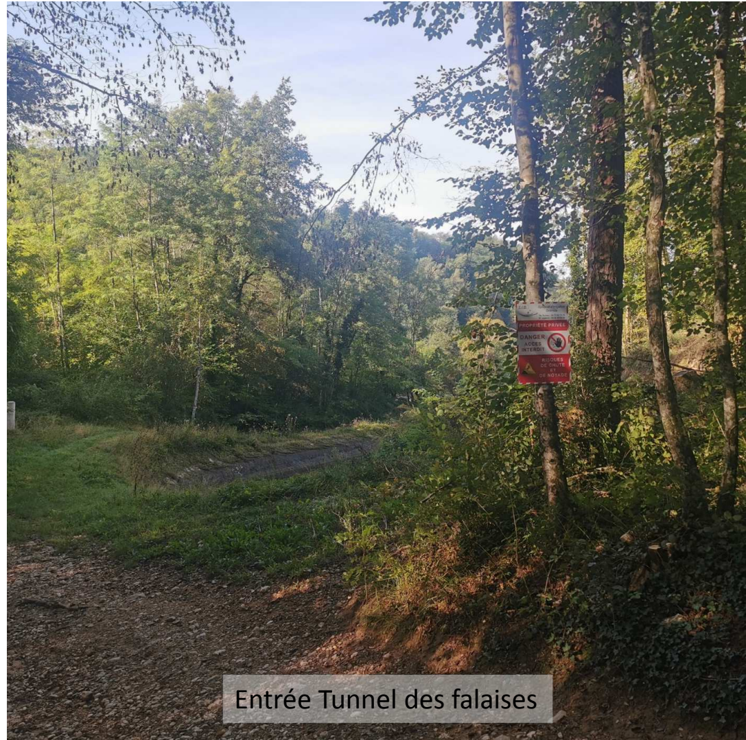
Entrée Tunnel des falaises