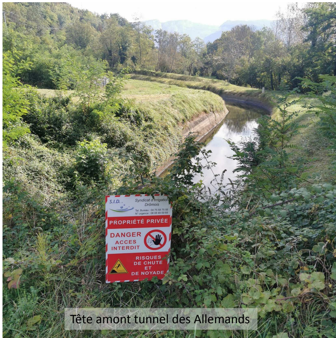
Tête amont tunnel des Allemands

ID : 026-200040517-20231004-20231004_01-AR