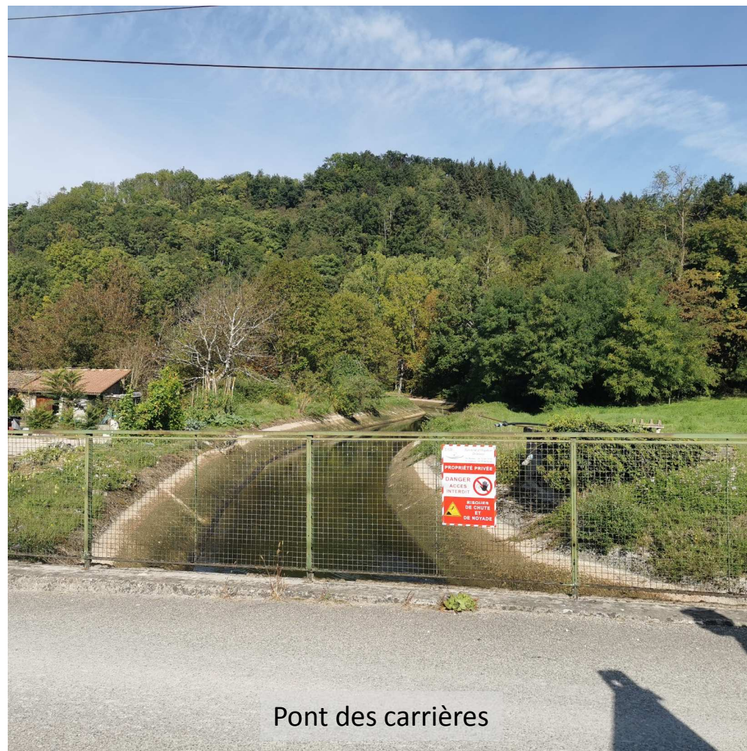
Pont des carrières