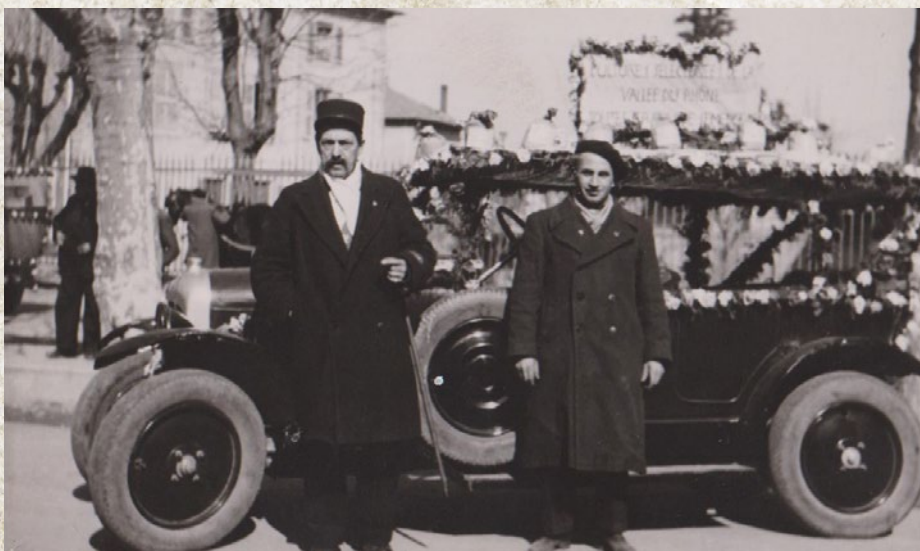
Fête des bouviers 1949