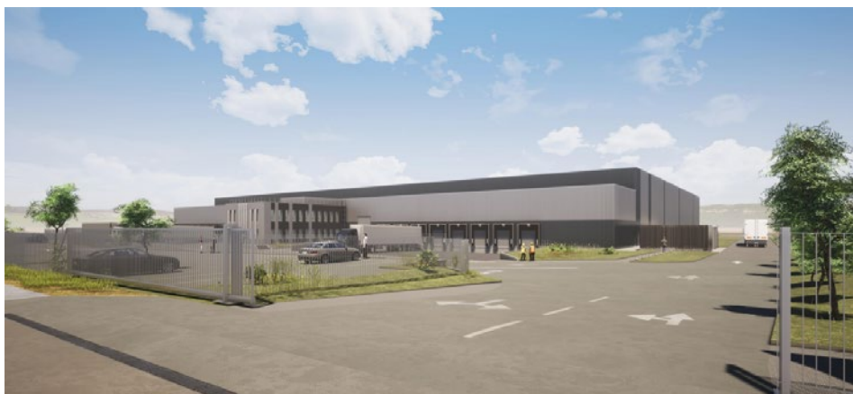
VUE DEPUIS LA RUE BLAISE PASCAL