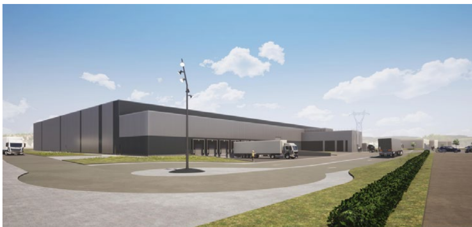
VUE DEPUIS LE CHEMIN DE LA FORÊT

L'exploitation du bâtiment est prévu courant du troisième trimestre.